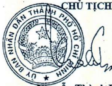
Nguyễn Thành Phong